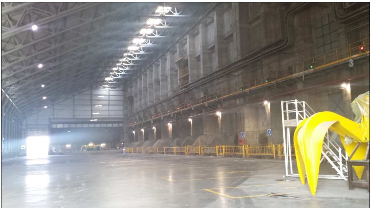
Figura 1_le 17 postazioni di scarico rifiuti all'interno dell'impianto

Di seguito alcune immagini dell'impianto scattate il giorno della visita.