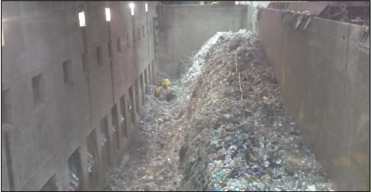
Figura 2_la vasca rifiuti e la preparazione della ricetta prima della combustione