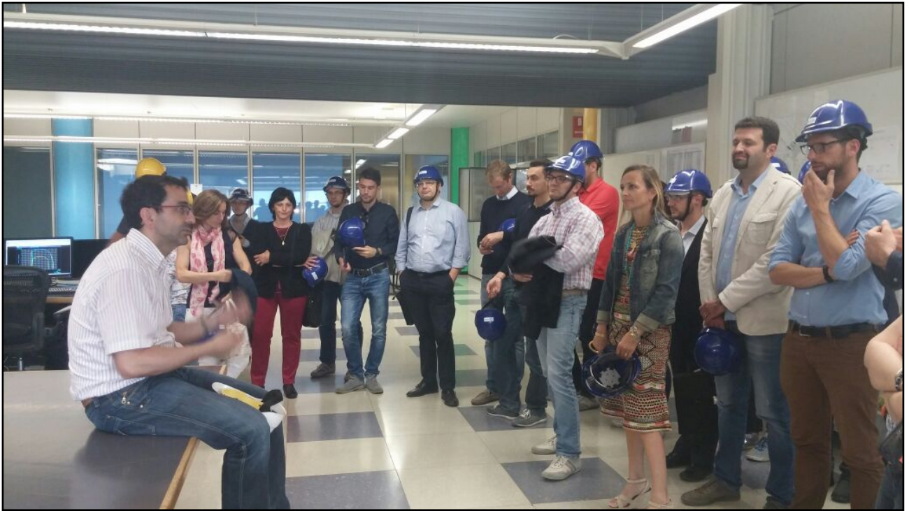
Figura 6_il gruppo nella sala di controllo