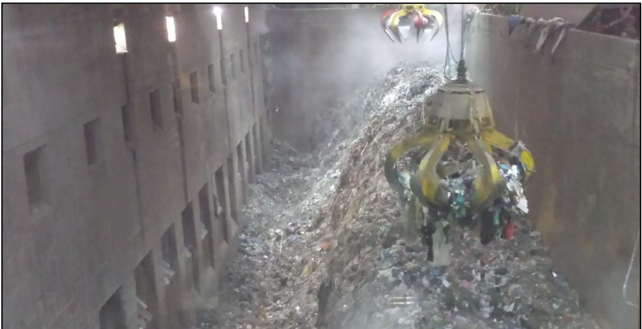
Figura 3_i ragni all'opera