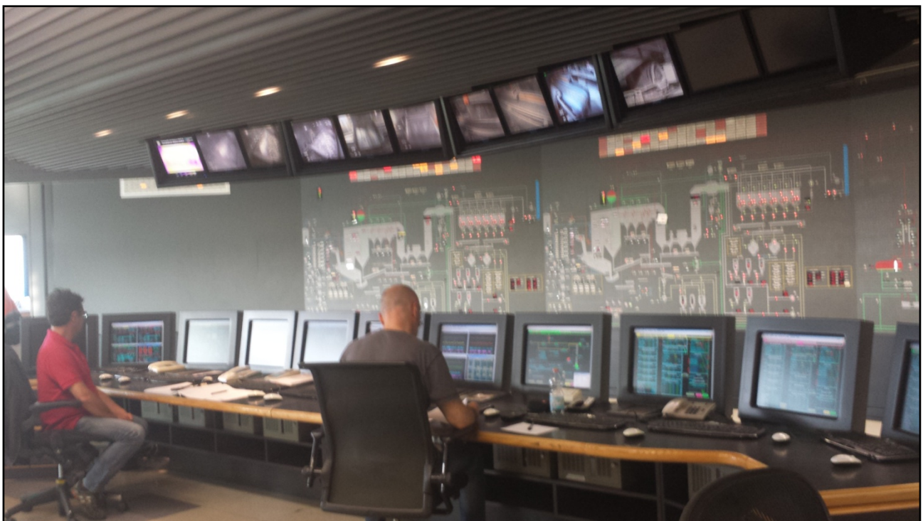
Figura 5 _la sala di controllo