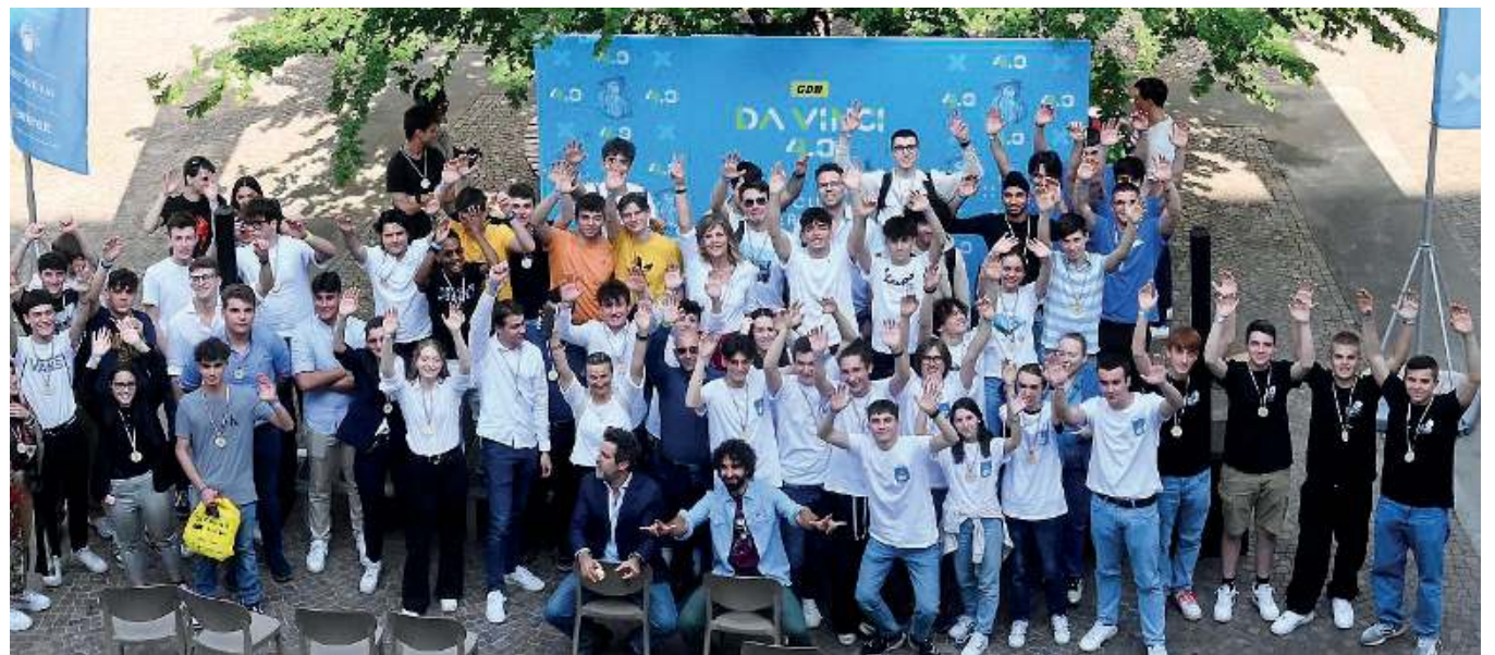
Lungo percorso. Il progetto è iniziato a gennaio con le visite nelle scuole ed è proseguito con i webinar tenuti dagli esperti

Il programma. Dopo i saluti istituzionali, alle 14.30 i giurati ascolteranno le presentazioni delle squadre, che avranno