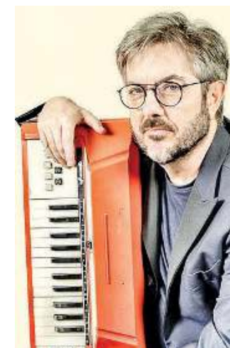
Musicista. Rocco Tanica