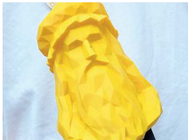
Il trofeo. La testa di Leonardo da Vinci stampata in 3D